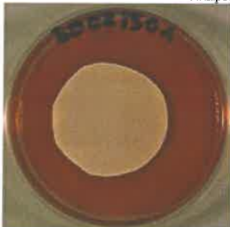
Assenza di sviluppo fungino su provino di ZEROEMME

Nella fotografia sottostante si può osservare la resistenza del campione all'attacco fungino.